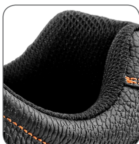
podšívka Cambrelle Cambrelle lining podszevka Cambrelle