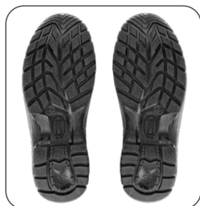
podešev outsole podeszwa