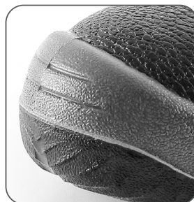
zesílená přední část proti okopu reinforced PU overcap nosek z PU wzmocnieniem