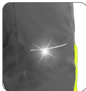
reflexní doplňky reflective accessories elementy odblaskowe