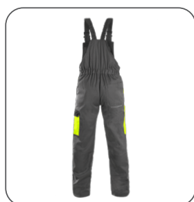
zadní strana back side z tyłu