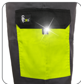
boční kapsa s klopou side flap pocket kieszeń boczna z patką